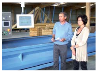
Rencontre à la SAS Ventura de Saint-Sauveur

L'installation de Center Parcs en Nord Vienne est une chance pour l'emploi dans le bassin châtelleraudais qui a subi de plein fouet les conséquences de la crise. C'est un enjeu majeur et une véritable opportunité avec la création de 600 emplois directs non délocalisables et environ 1000 emplois pendant les travaux. Le projet privilégiera les entreprises locales et 85 % des emplois seront réservés aux habitants de la Vienne.