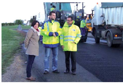
Visite d'un chantier de réfection de couches de roulement et de renforcement d'enrobés

Le Conseil général consacrera en 2013 près de 28 millions d'euros à l'amélioration du réseau routier départemental !