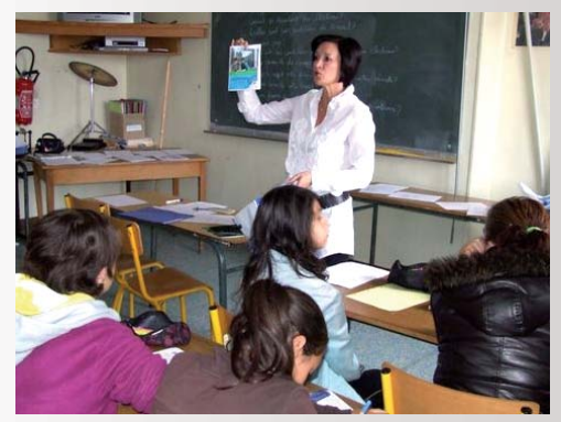
Remise de dictionnaires dans l'ensemble des établissements de la Vienne aux élèves entrant en sixième. Ici au Collège René Descartes

Pour maintenir un taux d'équipement informatique élevé, 193 ordinateurs, dont 15 nouveaux livrés en juin 2012, sont mis à disposition des élèves.